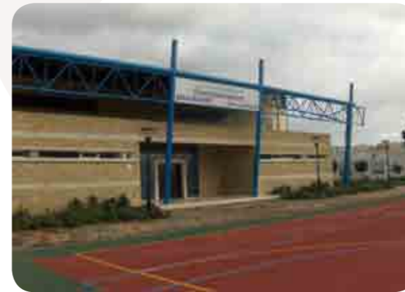
فضاء رياضي لمركب الأعمال الإجتماعية لبن مسيك

منذ انطلاقتها، وبرامج المبادرة الوطنية للتنمية البشرية تركز اهتمامها على البنيات الأساسية الموجهة لفائدة الشباب، فأكثر من 131 مليون درهم خصصت لتهيئة، وتجهيز، وإحداث المركبات متعددة الرياضات وملاعب رياضة القرب لأكثر من 260 ألف مستفيدا وذلك بغلاف مالي يقارب 27 مليون درهم من أجل تمويل 61 مشروعا لبناء دور الشباب، والمكتبات، والمجتمعات، ومأوى الشباب.