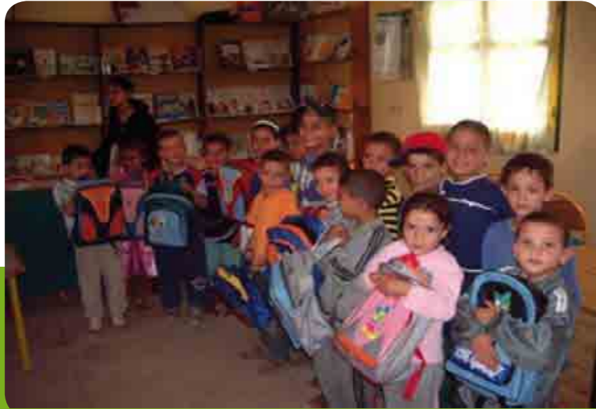
عملية توزيع المحفظات واللوازم المدرسية لفائدة التلاميذ المحتاجين

دأبت ولاية جهة الدار البيضاء الكبرى بشراكة مع وزارة التربية الوطنية، التعليم العالي، تكوين الأطر والبحث العلمي بمناسبة كل موسم دخول مدرسي على القيام بعملية توزيع محفظات لصالح التلاميذ المحتاجين (في وضعية صعبة). فمنذ انطلاقة المبادرة الوطنية همت 65 مشروع مبلغ يناهز 20 مليون درهم استفاد منها حوالي 118.790 مدرس. لكن سنة 2008 تميزت من خلال مبادرة مليون محفظة والتي أعطى انطلاقتها صاحب الجلالة الملك محمد السادس، نصره الله، باستفادة 204.000 مدرس ينحدرون من عائلات فقيرة بجهة الدار البيضاء الكبرى، موزعة على المدارس المتواجدة بـ 54 حي مستهدف ببرامج المبادرة الوطنية للتنمية البشرية. بالنسبة للموسم الدراسي 2009 - 2010 تستهدف المبادرة الملكية « مليون حقيبة » 288.744 تلميذ و تلميذة على صعيد جهة الدار البيضاء الكبرى، ينتمون إلى المجال الحضري و القروي.