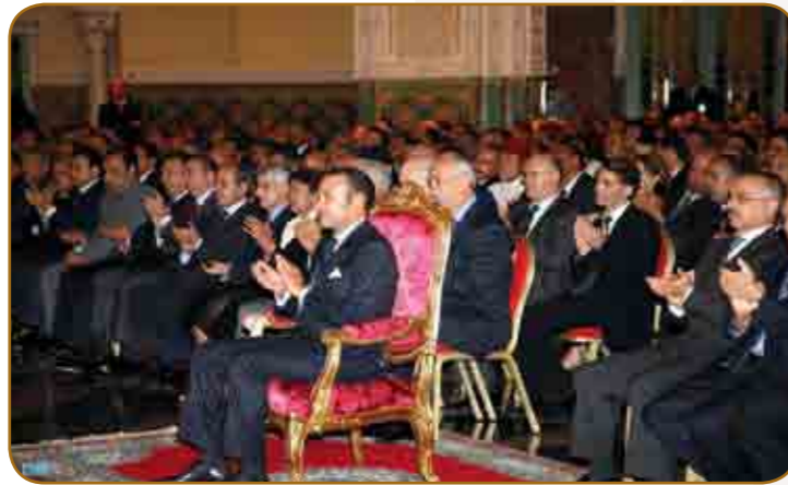
توقيع ميثاق الحكامة الجيدة بحضور صاحب الجلالة الملك محمد السادس نصره الله من طرف الجمعيات المشغلة في مجال مكافحة الهشاشة القصوى

تستلزم معالجة معضلة الهشاشة القصوى تعبئة المصالح الحكومية إلى جانب الجماعات المحلية وكذا فعاليات المجتمع المدني لضمان تقديم الدعم لأكثر الفئات المحتاجة، مع الأخذ بعين الاعتبار أهمية إعادة إدماجهم في النسيج الاجتماعي والعائلي والسوسيو مهني والمؤسساتي. وهكذا، ولضمان تغطية أوسع للخدمات الاجتماعية وآليات الاستقبال المقدمة لفائدة الفئات في وضعية الهشاشة، يتم دعم الجمعيات وإشراكها إلى جانب الجماعات المحلية في إطار برنامج متعدد السنوات لتأهيل المراكز الاجتماعية على صعيد كل تراب جهة الدار البيضاء الكبرى. يعتمد هذا البرنامج، الذي يعتبر من أهم البرامج التي تبنتها ولاية جهة الدار البيضاء الكبرى، بالإضافة إلى باقي برامج المبادرة الوطنية للتنمية البشرية، مقاربة تشاركية تساهم في ضمان انخراط الكل وتطوير الشراكات من أجل إنجاز المشاريع.