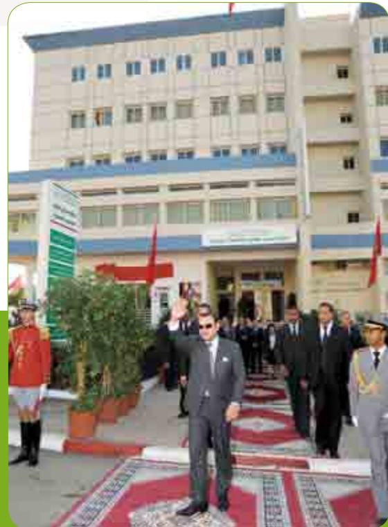
تدشين صاحب الجلالة الملك محمد السادس، نصره الله، لمركز التنمية البشرية بسيدي مومن بتاريخ 23 أكتوبر 2008.

تم اعتماد المقاربة التشاركية في تنفيذ برامج المبادرة الوطنية من خلال عمليات التواصل مع الجمعيات المحلية، وتحديد حاجيات الساكنة المستهدفة وترتيبها بحسب الأولويات، إضافة إلى وضع جدول زمني لتنفيذ الأنشطة البرمجة.