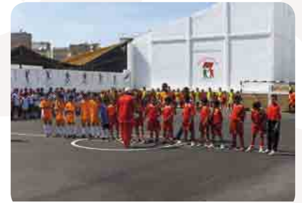
ملاعب رياضة القرب (عمالة مقاطعات الدار البيضاء أنفا)