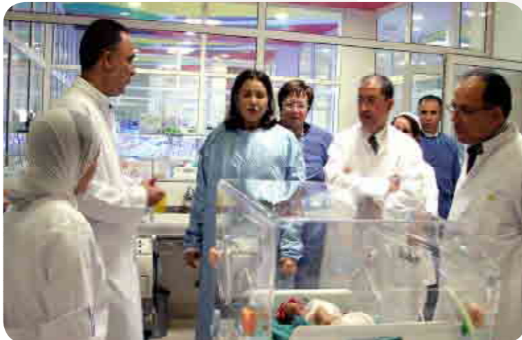
صاحبة السمو الملكي الأميرة للا مريم تدشن مركز الأطفال الخدج بالدار البيضاء

ففي المجال الصحي اتخذت عدة مبادرات مشتركة من خلال 160 مشروعا، حيث إنه أتيحت الاستفادة لما يزيد عن مليون مستفيد من الخدمات الصحية الأولية، كالمراكز الصحية والقوافل الطبية ودور الولادة... بغلاف مالي قدر بـ 127 مليون درهم، منها 57 مليون مولت من طرف المبادرة الوطنية للتنمية البشرية.