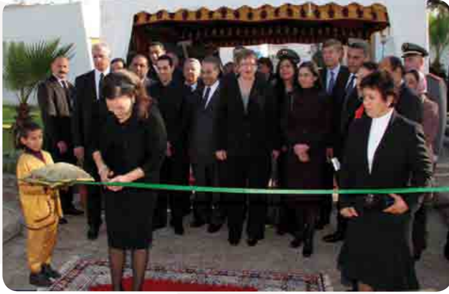
تدشين صاحبة السمو الملكي الأميرة للا حسناء لمركز للا حسناء للأطفال المعاقين المتخلى عنهم بتاريخ 2009 /08/02