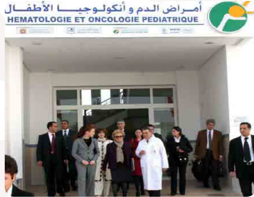
صاحبة السمو الملكي للأسلمى، رئيسة جمعية للأسلمى لمحاربة داء السرطان رفقة السيدة بيرناديت شيراك، في زيارة لمركز الدم و انكولوجيا الأطفال بمستشفى 20 غشت، بتاريخ 23 فبراير 2009

ميزانية التسيير 12 مليون درهم في السنة .