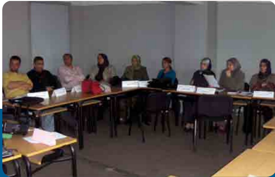
لقاءات التكوين من أجل تقوية القدرات المحلية

ومنذ بدء تنفيذ برامج المبادرة الوطنية للتنمية البشرية، تمت برمجة 504 يوما من التكوين، ووصل عدد المستفيدين منها إلى 4021 مستفيدا. تركز هذه البرامج على المبادرة، والتطوير، والخبرة في مجال الهندسة الاجتماعية والتنمية البشرية.