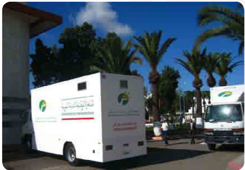
شاحنة متنقلة للكشف عن مرض سرطان الثدي تابعة لجهة الدار البيضاء الكبرى