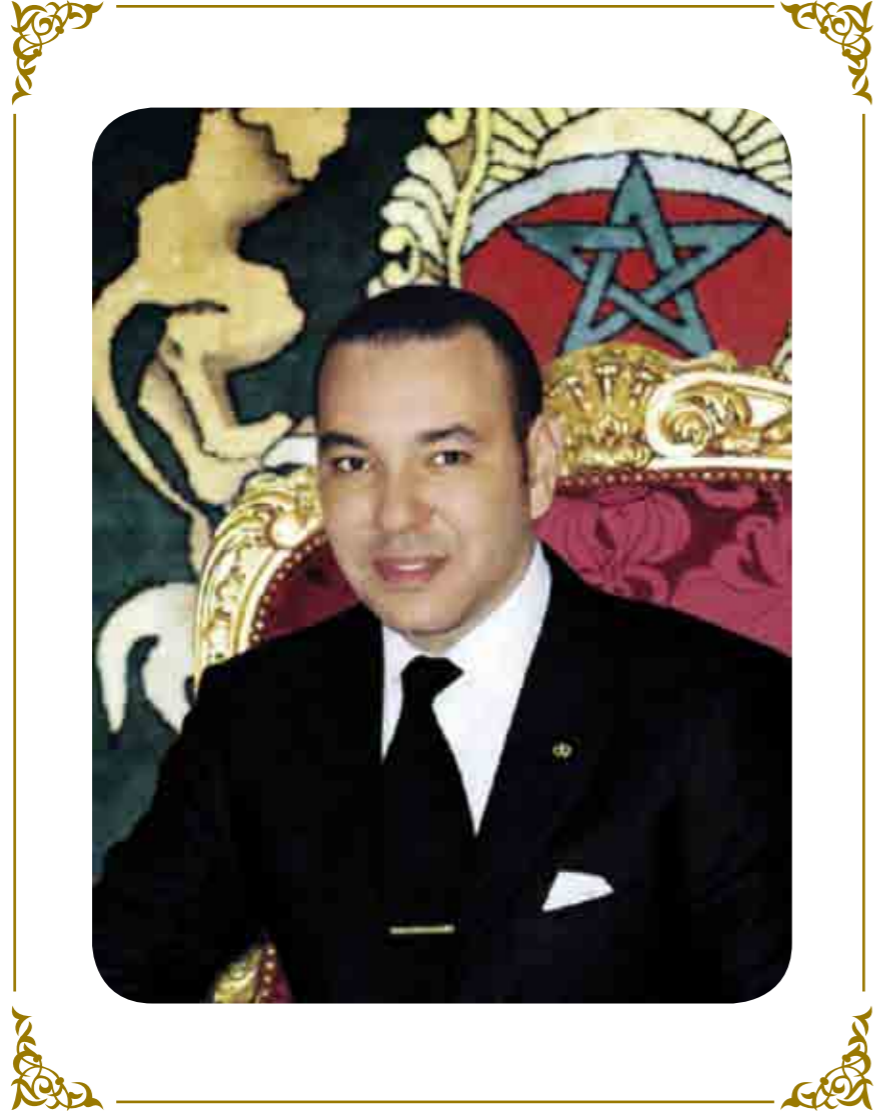
صاحب الجلالة الملك محمد السادس نصره الله