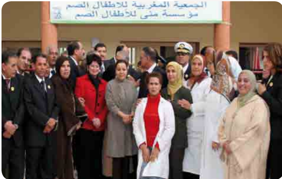
تدشين صاحبة السمو الملكي الأميرة للا أسماء لمشروع توسيع وتهيئ مؤسسة «منا» للأطفال الصم بالدار البيضاء بتاريخ 2008 /12/11

خطاطة للتكفل الاجتماعي للسكان المستهدفة بمركز التنسيق