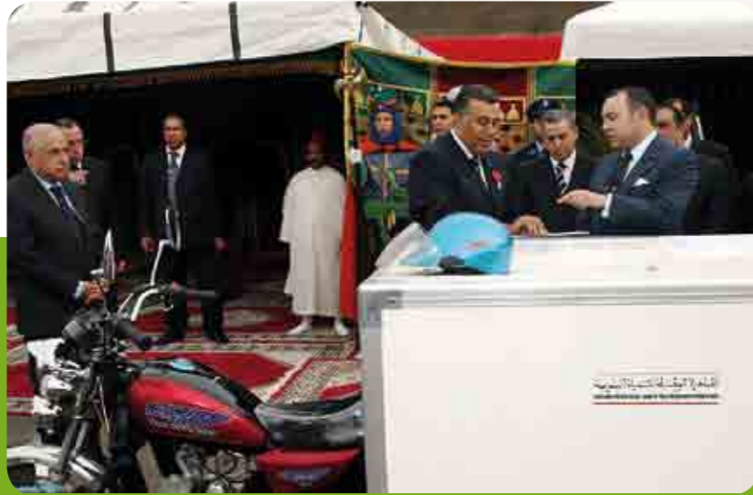
تأهيل البائعين المتجولين ( عمالة الدار البيضاء )